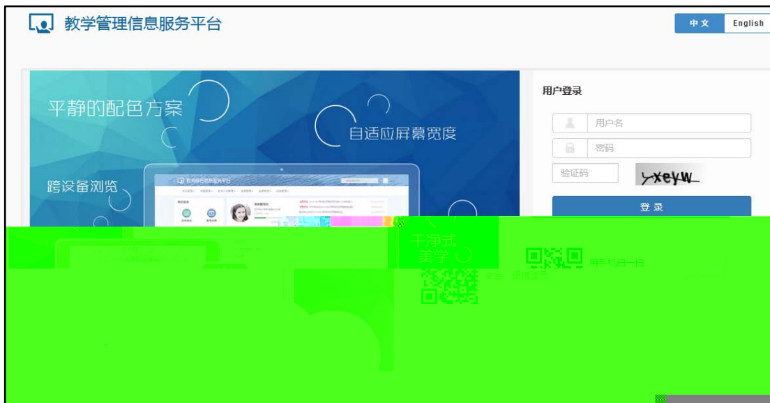
Ä . 1 ,« ... í5 Ä