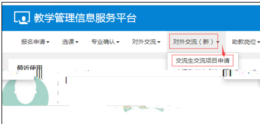
Ä . 2-1 +cB' Ä